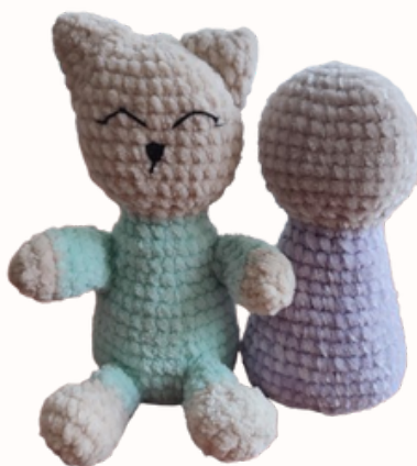
Test és fej egyben

Lezárás: Vágd el a fonalat, hagyj szálat az elvarráshoz. Haladj körkörösén a varrótűvel, hogy eltűnjön a lyuk, majd rejtse el a fonalvéget a testben.